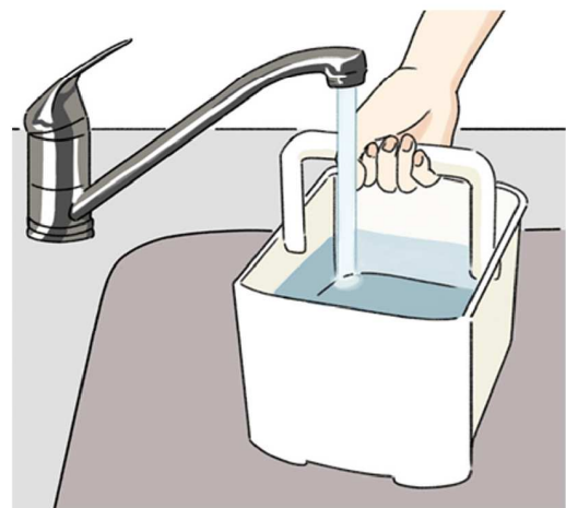
どのタイプの加湿器も、水道水を使いましょうね

加湿器の 使い方のポイント 加湿器を置く場所は、ズバリ！部屋の中心付近。効率良く部屋全体を加湿できます。部屋の中心に置くのが難しい場合は、エアコンの吸入口の近くに置くことで、エアコンの風とともに加湿された空気も部屋に広がります。ちなみに、壁際や窓際に置くと、カビや結露の原因になりますし、家電のそばに置くと故障の原因に。木製家具の近くも、湿度によって劣化させてしまう恐れがあるので、おすすめしません。また、部屋の出入り口付近も、せっかく加湿された空気が逃げやすくなるので、避けたほうが良いです。 置く高さも重要で、湿気は、下に貯まりやすいので、床から50センチ～1メートルの高さが良いそうです。