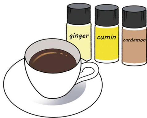
カフェ・デ・ゼピスのスパイスは、ほかにも、しょうが、クミン、カルダモンもおすすめて♪

コーヒーを淹れ、仕上げにブラックペッパーや、シナモン、ナツメグなど、お好みのスパイスを入れれば完成！コーヒーは、もちろん、インスタントでもOK。砂糖やちみつなど、甘みを加えても美味しいです。アイスドリンクを、暖かいお部屋で楽しむのはいかが？