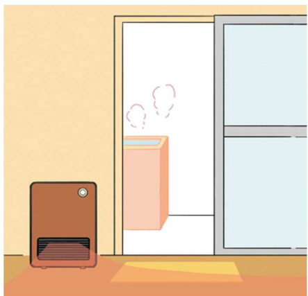
湯上りに脱衣所が寒いのも危険なので、脱衣所を暖めましょう

ありますが、朝が寒いこの時期は、ヒートショックの危険もあります。どうしても入りたいときは、事前にシャワーのお湯や、浴室暖房などで、浴室を温めてから入りましょう。