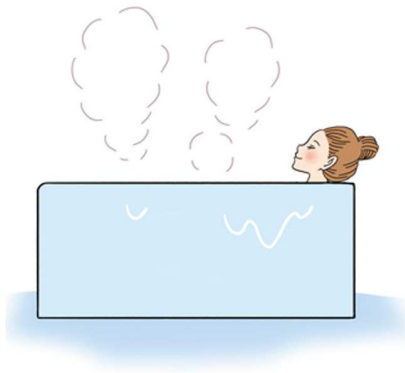
10〜15分ほど浸かるのがおすすめです♪

かからず、筋肉もゆるんでリラックスできます。ぬるく感じるかもしれませんが、ゆっくり浸かると、体がぽかぽか温まりますよ。