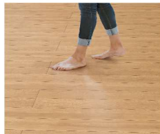
ラシッサ SフロアUD フリエーブル

人のすべりに配慮 ラシッサ Sフロア UD 一般的な床と比較して人が滑りにくい床の表面に防滑ハイパーフィルムを採用。床のすべりによる転倒や足腰の負担を軽減させます。