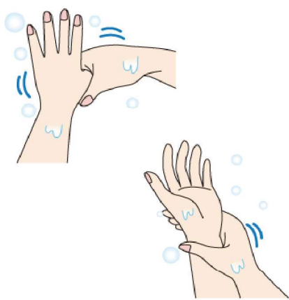
手洗いは、親指や手首もお忘れなく！優しくねじるように洗うと良いですよ！

爪や指先などを洗います。各5回を目安にすると、キレイに洗うことができますよ。水でよくすすいだら、清潔なタオルやペーパータオルで拭きましよう。