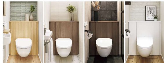
▲ライトオーク ▲ウォールナット ▲ショコラオーク ▲ホワイト