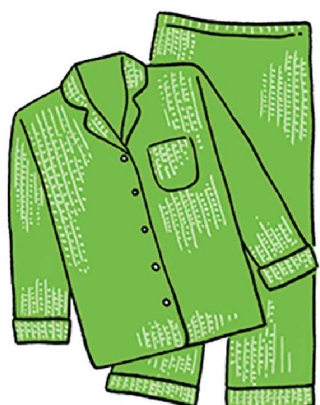
ちぢみやサッカー生地など、ポコポコと凹凸のある素材は、肌との接着面が少なくなるため、さらっとした着心地に。

●快眠できる環境をつくる 寝不足は、熱中症のリスクを高めてしまいます。エアコンはもちろん、接触冷感シート、頭を冷やす枕など、涼しさを感じるアイテムを上手に使いながら、快眠を目指しましょう。