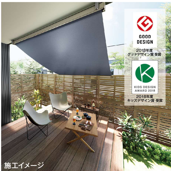
施工イメージ インディゴデニム