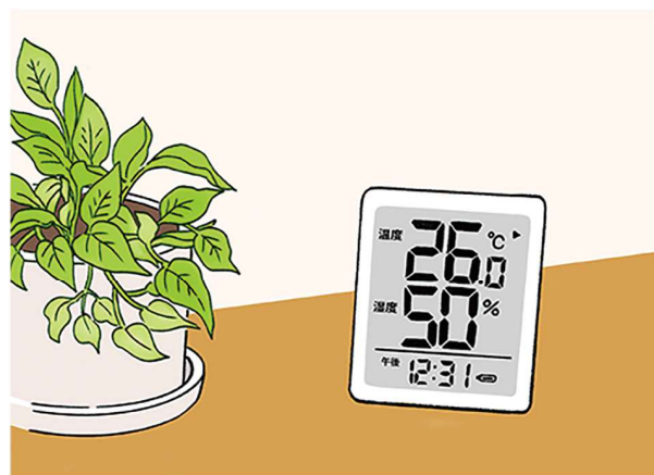
一般的に、過ごしやすい室温は、25～28度、湿度は45～60%とされているので、目安にすると良いですね。

●温度・湿度をチェックしましょう 室内の環境状況を知ることが大切。温度・湿度計を設置し、室内の状況をチェックすることで、エアコンなどを調節できます。熱がこもりやすいキッチンや、子ども部屋で、子どもが遊んでいるときもチェックをお忘れなく。