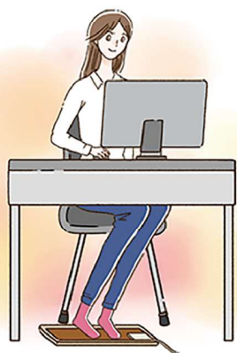
足元に置いて使うミニサイズのホットマットはリモートワークにおすすめ！効率良く足元を温めることができます。

ホットカーペットは、足元を温めるのに、とても助かります。しかし、長時間使用すると電気代がかかるので、半分だけ温める機能や省エネモードを使うと良いですよ。ひざ掛けや毛布の併用もおすすめ。また、専用のカバーかホットカーペット対応ラグをかけて使うようにしましょう。