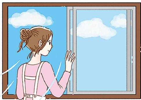
適度な換気も大切。掃除の際や部屋を移動するときなど、ちょっとした合間にすると、おっくうになりませんよ。