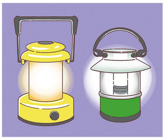
100円ショップにはランタンも豊富にあるので、手軽に取り入れられますね

避難所で過ごす場合、肌に着けるものも普段と同じものがあると良いですね。下着の替えや、女性ならいつも使っている生理用品も必須。着替えることで不快感を軽減することができます。マスクも、大きさやフィット感、顔に当たる素材の感じなど、好みのものであるのではないのでしょうか？ お気に入りを入れた避難袋などに入れておくと安心ですね。