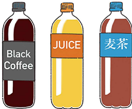
お気に入りのジュースやコーヒーがあると、慣れない場所でも少しほっとできるそうです

避難所で過ごす場合、肌に着けるものも普段と同じものがあると良いですね。下着の替えや、女性ならいつも使っている生理用品も必須。着替えることで不快感を軽減することができます。マスクも、大きさやフィット感、顔に当たる素材の感じなど、好みのものであるのではないのでしょうか？ お気に入りを入れた避難袋などに入れておくと安心ですね。