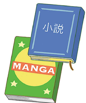
マンガや本などがあると、不安を紛らわせることにひと役買います

いざという時でもほっとできるもの 断水した場合、水は貴重です。そこで、マウスウォッシュやウェットシート状の歯磨きなど、水を使わなくても済む歯磨きセットがあると助かります。歯をきれいにすることは、衛生上必要なことはもちろん、気分転換にもなります。 アロマの香りも役立つのでお気に入りの香りのものや、癒しをもたらしてくれるラベンダー、殺菌効果のあるミント系などを備えておくとうり便利。ハンカチに1〜2滴たらしてゆっくり吸うのもおすすめです。 100円グッズでかわいいキャンプグッズ品が出ていますので、それらを防災グッズに活用するのもおすすめです。たとえば、紙皿や紙コップ、割りばしなど、使い捨てのモノでもお気に入り