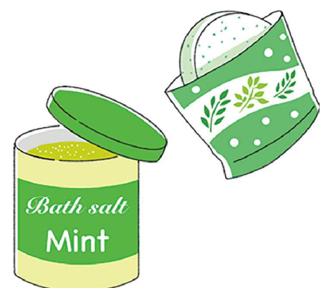
清涼感のある夏向けの入浴剤が豊富にあるのでチェックしてみてください

ほかにもちょっとした工夫で節電に。カーテンやブラインドで直射日光を防ぐとお部屋の快適さもアップ。遮熱カーテンもおすすすめです。暑いと冷蔵庫を開ける回数も増えますが、開けると冷気が外に漏れ、閉めた時に冷やそうと電力を消費するので、開閉の回数を減らすことも大切です。