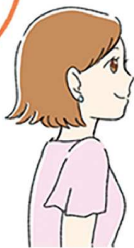
美術館や映画館で涼みながら芸術に触れるのも良いですね！

ほかにもちょっとした工夫で節電に。カーテンやブラインドで直射日光を防ぐとお部屋の快適さもアップ。遮熱カーテンもおすすすめです。暑いと冷蔵庫を開ける回数も増えますが、開けると冷気が外に漏れ、閉めた時に冷やそうと電力を消費するので、開閉の回数を減らすことも大切です。