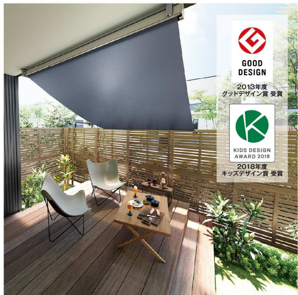
インディゴデニム