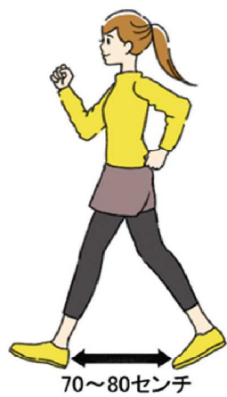
歩幅は広めの70〜80センチが良いそうです

手を椅子などに添え、足は肩幅くらいに広げてまっすぐ立ちます。つま先立ちになり、重心をかけながらかかとを床につきます。これを1セットにつき10回、1日3セットがおすすめです。ほかに、仰向けに寝て膝を立てます。片足の膝を伸ばしてゆっくり持ち上げ、5秒ほどキープして元に戻します。これを片足5〜10回繰り返しましょう。