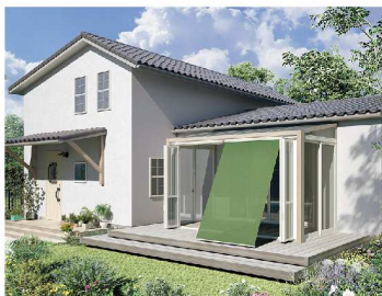
フォレストグリーン