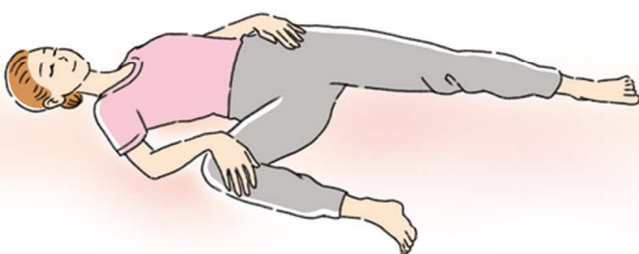
ストレッチは無理のない範囲で行いましょう

骨といえば股関節をやわらかくすることもとても大切。股関節が硬いとケガなどのリスクが高まります。簡単なストレッチとしては、仰向けに寝て、片足の膝を胸へ引き寄せ、膝で円を描くように回します。ほかに、仰向けで寝て片足の膝を90度曲げます。膝の内側付近に手を添え、そのままゆっくり側面の床に倒します。そのとき、足を伸ばした側の腰が浮きすぎると十分に伸ばせないの、足を伸ばした側の手で鼠径部付近を押さえましょう。