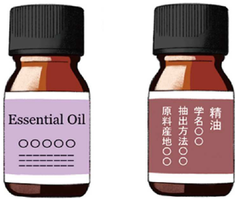
茶色などの遮光瓶に入り、表示に「精油」や「エッセンシャルオイル」とあるので、確認してみましょう

香りと言えばオイル。さまざまな香りがありますね。ちなみに、一般的によく「アロマオイル」と言われていますが、「エッセンシャルオイル（精油）」と違いがあります。エッセンシャルオイル（精油）は、100%天然成分の香りで、香りそのものを楽しむのはもちろん、マッサージなどにも使えます。アロマオイルは、精油100%でないものや、人工香料のものがあります。直接肌につけることは避けた方がいいですが、手軽に香りを楽しめるメリットがあります。