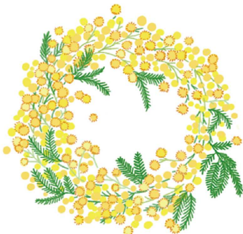
ミモザはリースにしても素敵！インターネットでも手に入るのチェックしてみては？

ハーブティーや生花で和み、気分を上げよう♪ ハーブティーで味わいととも香りを楽しむのも良いですね。スッキリとした味わいのカモミールや、最近、シロップもよく見かけるエルダーフラワーは、鎮静効果があると言われています。 ハーブティーの淹れ方は、ティースプーン1杯をポットに入れ、95℃程度のお湯を静かに注ぎ、フタをして3〜5分蒸らしてからカップに注ぎましょう。ハーブティーはきれいな色も魅力。ぜひ、耐熱ガラスのカップで楽しんでみてください。 生花もおすすめ！自然ならではの繊細で色鮮やかな見た目と香りに気分が上がります。ミモザは、黄色い小さな花がかわいく、葉っぱの表情とも相まって、とっても華やか。ざっくり