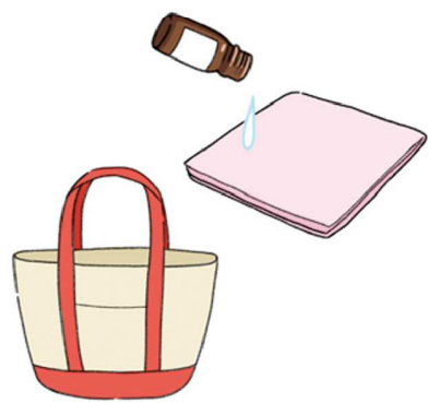
ハンカチに1滴オイルを落とし、嗅ぐのも効果的。外出先にも携帯できますね♪

新たな環境で生活を始める人が多い時期でもありますね。不安な気持ちをやわらげる香りで癒されましょう。ラベンダーはリラククスを誘う香り。ベルガモットやグレープフルーツなどの柑橘系の香りはさわやかで、リラククスはもちろん、イライラすると