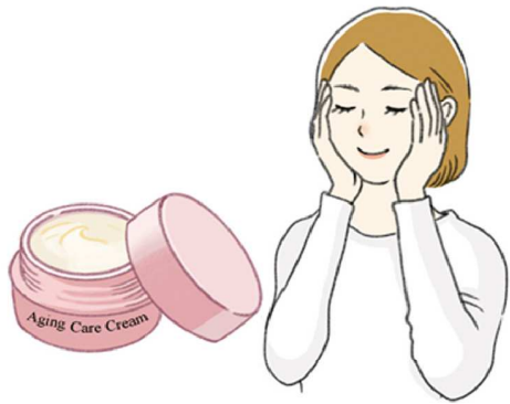
エイジングケア用のクリームやオールインワンジェルでマッサージするのもおすすめです

す。左右終わるころに結構疲れますが、やるうちに慣れますし、表情筋がほぐせて、ほうれい線のケアにもなります。ただし、やりすぎはあごの負担につながるので禁物です。ほかに、顔を上に向け、舌を出して鼻に近づけるように伸ばして10秒間キープ。あごまわりの筋肉を鍛えるのにおすすめです。