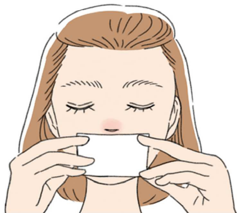
リップケアの前は、お湯で濡らしたコットンなどで唇を温めてからやると効果的♪

たり、汗で蒸れたらこまめに拭いたりすることをすすめます。肌荒れは、肌の潤いを保つ成分「セラミド」が不足しているとも言われているので、セラミド配合の化粧水を試してみるのも良いですね。また、化粧水だけで済ませるのではなく、乳液、またはクリームなど、基本的なフェイスクアを心掛けましょう。