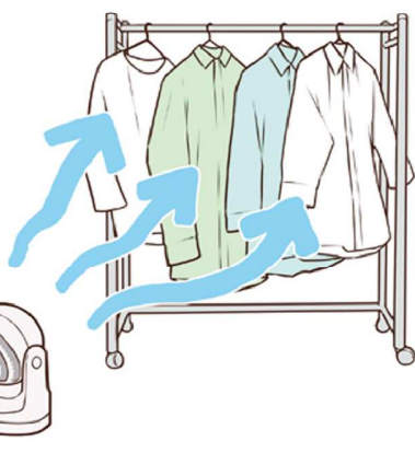
部屋干し時、扇風機やサーキュレーターも、下から上へ風を送るようにすると良いですよ。

部屋干しをする際にも、除湿器や、扇風機、サーキュレーターは大活躍。洗濯物の部屋干しをする場合、だいたい5時間以内に乾かすと生乾きのニオイを軽減できるそうです。また、洗濯物は上から乾き、水分が下へ行く傾向にあるため、除湿器を使うなら、干した洗濯物の下に、40〜50センチ程度離して置くことで、効率的に乾かすことができます。