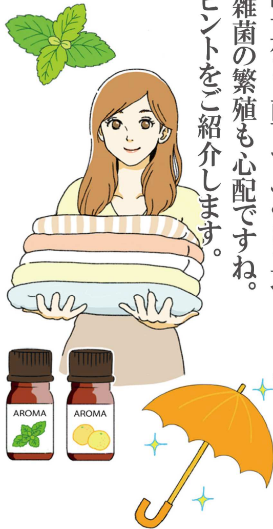
効率よく除湿するポイントです。

置く場所はズバリ、部屋の中心付近がベスト。湿った空気を吸い込んで除湿する吸気口と、乾燥した空気を出す送風口が別の面になっている仕様が多いので、端に置くと、どちらかの気流が妨げられ、効力が不十分になります。また、扇風機や、サーキュレーターを除湿器の対角に置き、併用して空気の流れをつくることで、より効果的に除湿できます。除湿する際は、部屋の窓や戸を閉めることも、