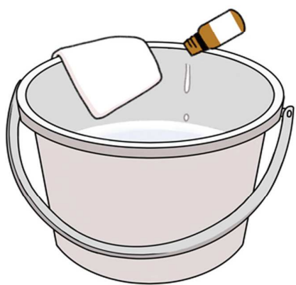
バケツの水にアロマオイルを3〜4滴たらして拭き掃除に使うのもおすすめです♪

に香りを拡散させても良いですし、ティッシュやお湯を入れたマグカップに、1〜2滴たらして嗅ぐのも良いでしょう。ちなみに、ディフューザーは水を使いますが、あくまで香りを拡散させるもので、加湿器とは違うのでご安心を。ほかに、器に重曹を入れ、アロマオイルを5〜10滴たらして玄関などに置くと、さわやかな雰囲気になりますよ。