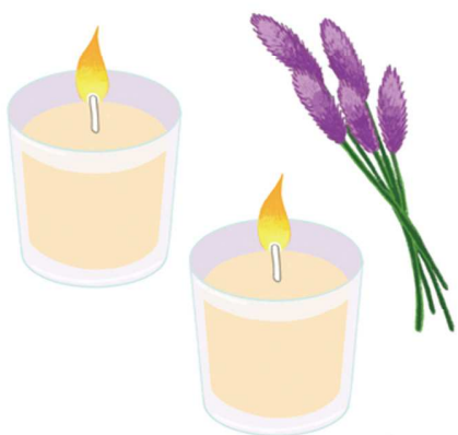
アロマキャンドルで好きな香りを楽しむのも良いですね

ンドルをともし時間が短いと、中心だけ溶けてしまい、その寿命が短くなるので、1時間以上灯すことで、キャンドルの表面が均等に溶けて、長く楽しめるそうです。 火が苦手な人は、LEDキャンドルの温かみのあるあかりでその雰囲気を味わうのも良いですし、アウトドアブームで人気のランタンを部屋で使うと、非日常的な雰囲気が楽しめます。